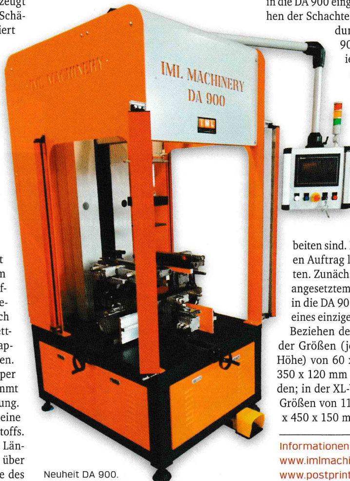
Neuheit DA 900.

Informationen: www.imlmachinery.com www.postprintleipzig.com