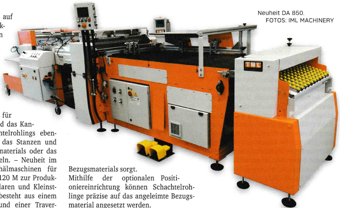
Neuheit DA 850.

Weitere Neuheit ist die DA 850, laut IML Machinery ein „Multitalent“ zum Anleimen, dessen modularer Aufbau die Anpassung an viele Anforderungen erlaubt. Hiermit lassen sich Bezüge für Feinkartonagen, Brettspiele, Decken aller Art, Sammelmappen, Ordner u.a. Produkte verarbeiten. Bezugsmaterial kann manuell oder per Anleger zugeführt werden, es kommt Kaltleim oder Heißeim zur Anwendung. Eine Viskositätskontrolle sorgt für eine konstante Verarbeitung des Klebstoffs. Der in zwei, vier oder sechs Metern Länge verfügbare Arbeitstisch verfügt über ein Vakuum, das für exakte Planlage des