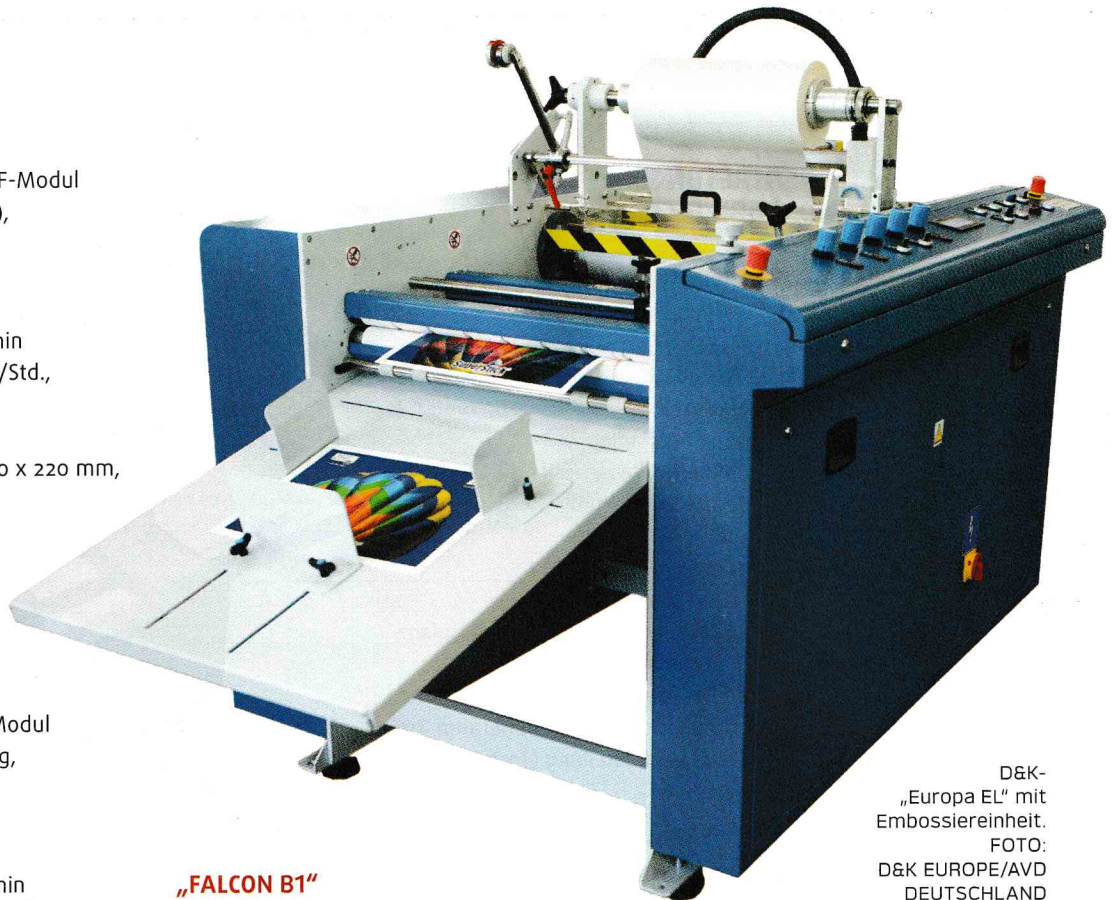
D&K- „Europa EL“ mit Embossiereinheit.