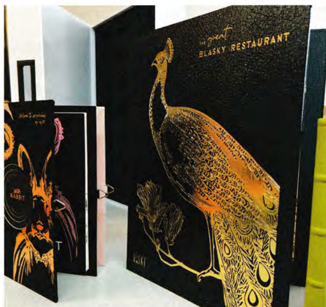
Speisekarte für Gourmetlokal: Dabei wurden von der Buchbinderei Bruder die Buchdecke produziert, das großflächige Grafikmotiv auf der Vorderseite geprägt, der mehrteilige Aufbau im Inneren mit Einsteckrahmen sowie Steppstichheftung und à la carte-Menü jeweils mit geprägtem Umschlag verantwortet, letztlich wurde die Speisekarte mit Buchschrauben fixiert.